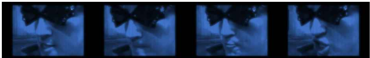
Imágenes extraídas de la vídeo-comunicación de la abogada con Sebastià.